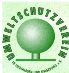
Umweltschutzverein in Isernhagen und Umgebung e.V.