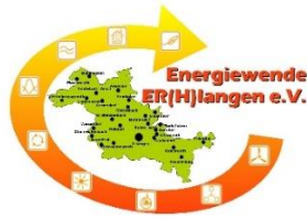
Energiewende ER(H)langen e.V.