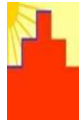
SunOn, Sonnenkraftwerke Lüneburg e.V.