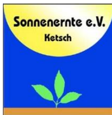
Sonnenernte e.V. Ketsch